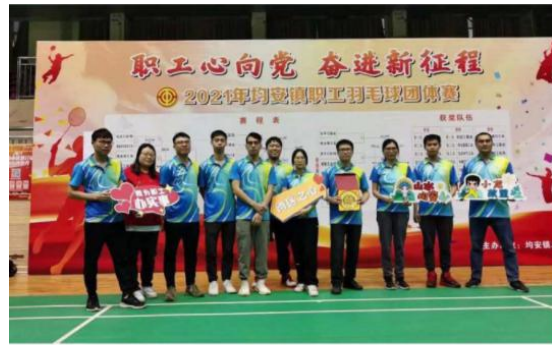
2021年羽毛球比赛均安镇第三名